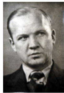
Aleksandras Ramanauskas 1946 – 1948 m.