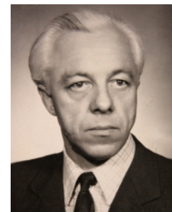
Anicetas Mockus 1981 – 1987 m.